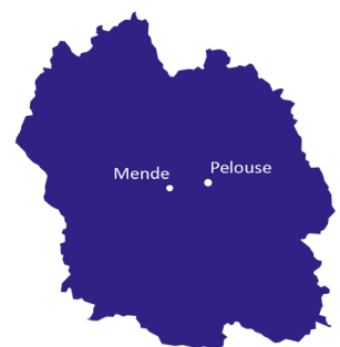
Département de la Lozère

La commune de PELOUSE fait partie de la Communauté de communes Cœur de Lozère.